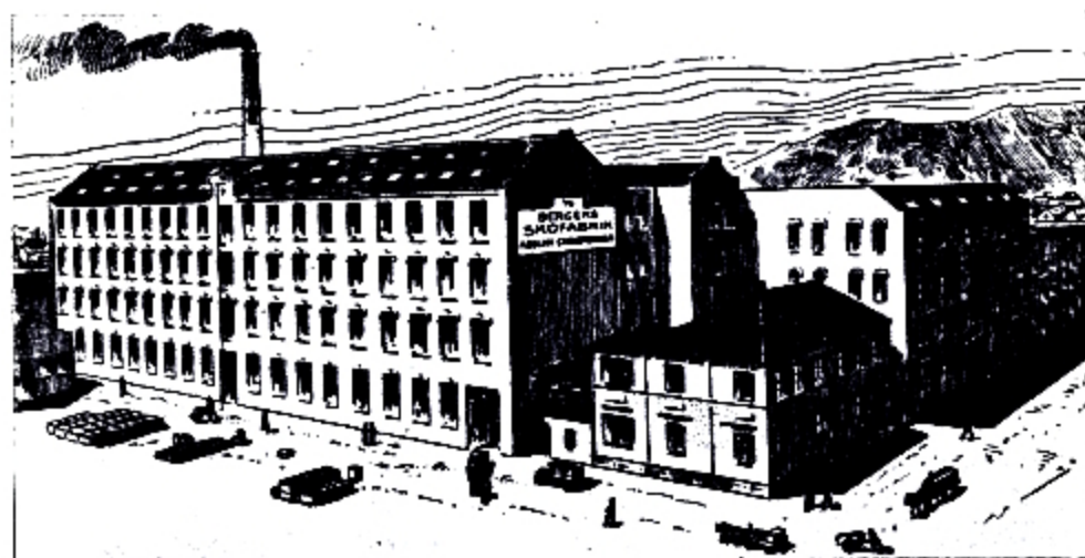
Fabrik- og kontorbygning.

kjøptes en del bygninger i nærheten av jernbanestasjonen, med strannrett og kai til Store Lungegårdsvann. Den største av bygningene som huser selve fabrikk-anlegget måtte undergå betydelige forandringer og ombygging, for det gjaldt å få det nye anlegg helt moderne i enhver henseende. Der blev da heller ikke spart på noget for å bringe anlegget på høide med det beste som kunde skaffes. Der installertes helt nytt maskinmateriell. Bare for bunnfabrikasjonen er der ialt 120 maskiner, dessuten finnes spesialmaskiner av forskjellig art og 36 symaskiner for det såkalte nåtlingsarbeide. Kort sagt, alt er gjort for å gjøre produksjonen så lett-