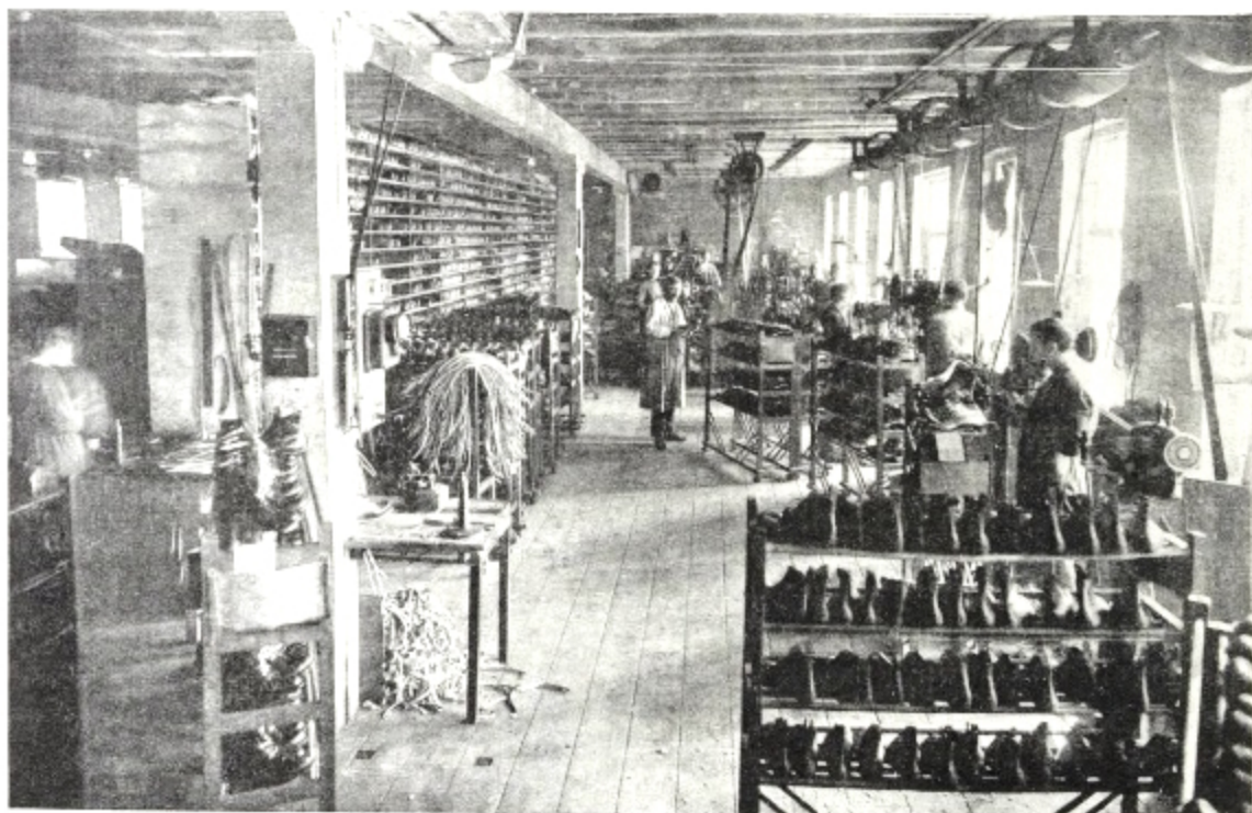
Pinderiet og randafdelingen.